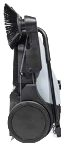
Бункер остаётся на месте, даже когда машина хранится в вертикальном положении или висит на стене.