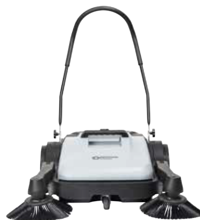
Машины SW200 (с одной боковой щёткой) и SW250 (с двумя боковыми щётками) имеют рабочую ширину 70 и 90 см соответственно.