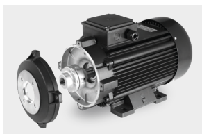
Motor-pump coupling with a flexible joint

Accoppiamento motore pompa mediante giunto elastico