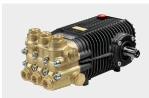
SW / TW Premium