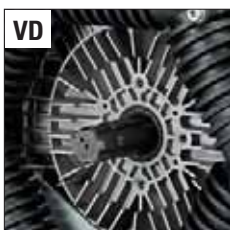
POST. - REAR - ЗАД.