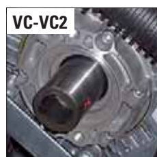
POST. - REAR - ЗАД.