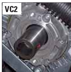
ANT. - FRONT - ПЕР.