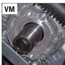
POST. - REAR - ЗАД.