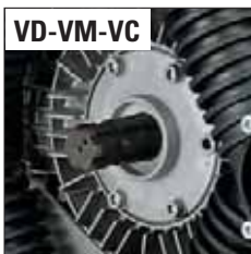
ANT. - FRONT - ПЕР.